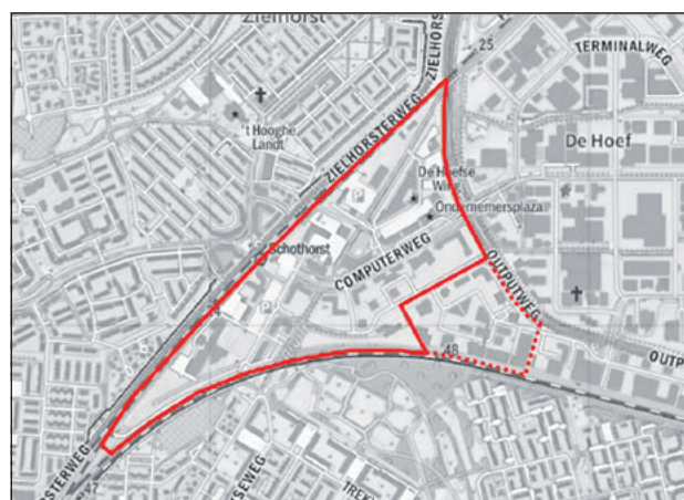
Hoefkwartier Globale begrenzing van het plangebied.

Voor (ruimtelijke) ontwikkelingen in de nieuwe stadswijk Hoefkwartier is per 1 januari 2022 een omgevingsplan nodig. Daarvoor moet eerst een Nota van uitgangspunten worden gemaakt. Het college heeft een conceptnota naar de raadsleden gestuurd. Tijdens dit rondetafelgesprek gaan de raadsleden onder andere met: inwoners, provincie, gebiedspartners en ontwikkelende partijen in gesprek over het omgevingsplan. Hoe worden onderwerpen daarin geregeld; wat is de juiste balans tussen regelen en loslaten?