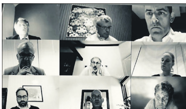
Digitale vergadering van de auditcommissie.

20.45 uur. Hybride vergadering (raadsleden vergaderen vanuit de raadzaal of digitaal). Live te volgen via amersfoort.raadsinformatie.nl/live .