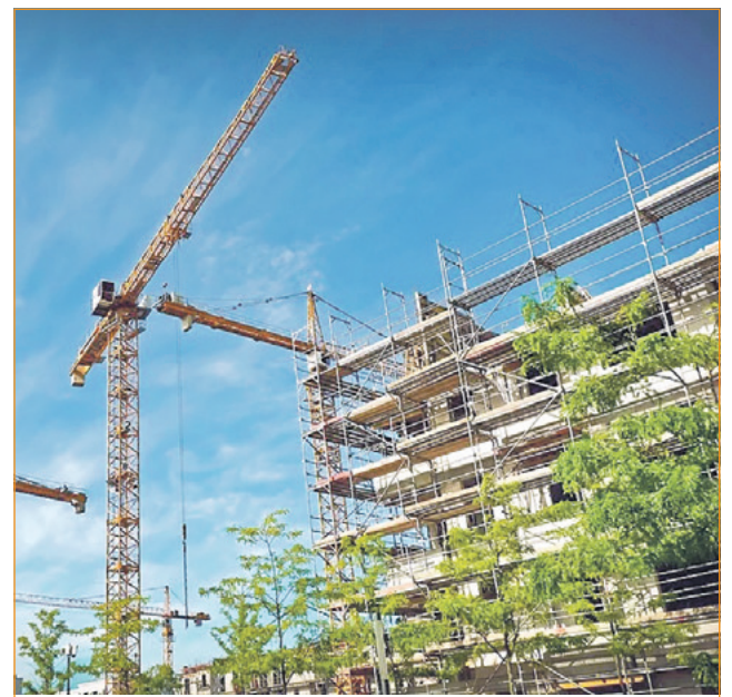
In de Omgevingsvisie komt te staan hoe de stad zich kan ontwikkelen tot 2030.

De aanbesteding en de veranderingen die het college voorstelt, hebben volgens de fracties ingrijpende gevolgen. Zowel voor de organisaties die dagbestedingen aanbieden als voor de kinderen/jongeren